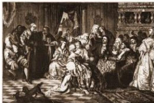
Ассамблея при Петре Великом. Картина профессора Лейбница, Гравюра Зенке из Штутгарта.

Как называлась первая печатная газета в России?